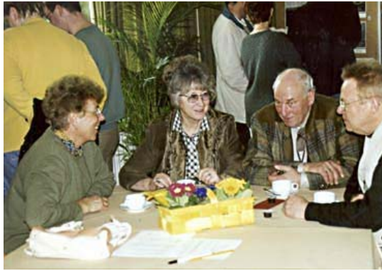
Bad Rehburger Bürgerinnen und Bürger im Gespräch während des Erzählcafés ...