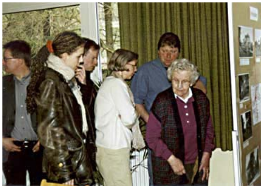
... und beim Studieren der Ausstellungsplakate

Die Ausstellung mit 25 großformatigen Vergleichsbildpaaren sowie ergänzenden historischen Aufnahmen wurde im Rahmen eines Erzählcafés an einem Märzwochenende im Dorfgemeinschaftshaus von Bad Rehburg der Öffentlichkeit präsentiert. Bei Kaffee und Kuchen bestand Gelegenheit zum Austausch von Bad Rehburger Geschichten, zur Erläuterung privater Fotos und zur Formulierung von Zukunftswünschen auf einer eigens dafür bereitgestellten Pinwand. Rund 150 Besucherinnen und Besucher nutzten die Gelegenheit und beteiligten sich am Erzählcafés. Dabei wurden den Veranstaltern weitere historische Fotos aus Privatbesitz zur Verfügung gestellt, die gleich im Nebenraum gescannt wurden, so dass sich niemand von seinen „Schätzen“ trennen musste.