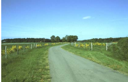
1-jährige Gehölzanzpflanzungen in der Feldmark mit blühendem Besenginster (5/01)

Die Pflanzmaßnahmen wurden von dem beauftragten Garten- und Landschaftsbaubetrieb Mund (Schneverdingen) im Winterhalbjahr 1999/2000 durchgeführt. Die Ergebnisse der Fertigstellungs- und Entwicklungspflege wurden Ende des Jahres 2000 bzw. 2002 unter Beteiligung der Teilnehmergeinschaft Otze-Blumenberg, des AfA Hannover, der unteren Naturschutzbehörde und der künftigen Unterhaltungspflichtigen abgenommen.