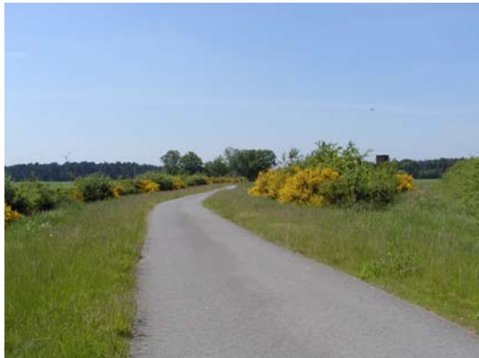
Vergleichsfoto der 5-jährigen Gehölzpflanzungen (05/05)

Die Pflanzmaßnahmen wurden von dem beauftragten Garten- und Landschaftsbaubetrieb Mund (Schneverdingen) im Winterhalbjahr 1999/2000 durchgeführt. Die Ergebnisse der Fertigstellungs- und Entwicklungspflege wurden Ende des Jahres 2000 bzw. 2002 unter Beteiligung der Teilnehmergeinschaft Otze-Blumenberg, des AfA Hannover, der unteren Naturschutzbehörde und der künftigen Unterhaltungspflichtigen abgenommen.