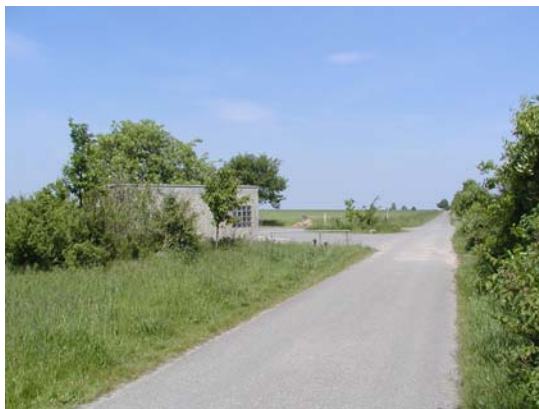
Begrünung des landwirtschaftlichen Waschplatzes bei Otze 5 Jahre nach der Pflanzung

Das Flurbereinigungsverfahren Otze-Blumenberg wurde vom Amt für Agrarstruktur (AfA) Hannover eingeleitet, um Flächenverluste und Flächenzerseuerungen auszugleichen, die im Zuge der Verbreiterung der Bundesstraße 3 im landwirtschaftlichen Bereich verursacht worden waren. Ein Teil der Flurbereinigungsmaßnahmen besteht aus Gehölzanzpflanzungen in Form von 3-reihigen Hecken und kleinen Feldgehölzen. Auf der Grundlage des Planes nach § 41 Flurbereinigungsgesetz (FlurbG) wurde die Ingenieurgesellschaft agwa GmbH damit beauftragt, die Anlage von zunächst 10 Gehölzanzpflanzungen zu betreuen.