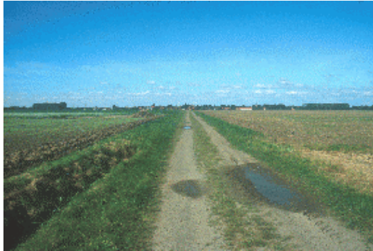
Feldweg im Süden von Machtsum