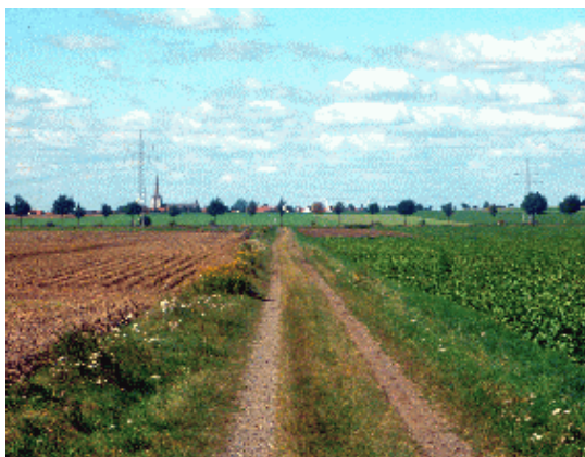
Blütenreicher Wegerandstreifen südlich von Machtsum

Im Rahmen des Flurbereinigungsverfahrens Machtsum wurde zur Beschreibung des Ist-Zustandes und als Grundlage für die Abarbeitung der Eingriffsregelung der Zustand von Natur und Umwelt erfasst und eine Hilfestellung für die Bewertung der Auswirkungen der geplanten Maßnahmen gegeben. Bewertet wurde nach der „Leitlinie Naturschutz und Landschaftspflege in Verfahren nach dem Flurbereinigungsgesetz“ (Informationsdienst Naturschutz Niedersachsen 2/2002)