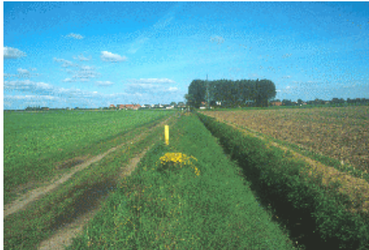
Feldweg im Westen von Machtsum

Die Kartierungen wurden im Sommer 2002 zunächst durch Luftbilddauswertung und anschließend durch Begehungen vor Ort durchgeführt.